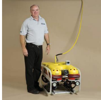
FALCON DR 1000m