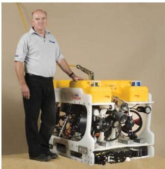
COUGER - XT コンパクト ( SKID 搭載モデル ) 300m