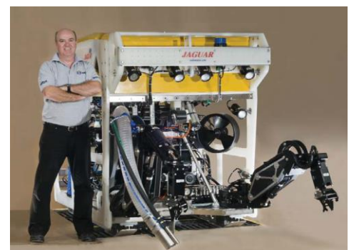
JAGUAR 3000m ( オプション 6000m )