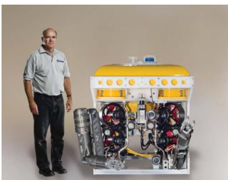
PANTHER-XT PLUS 1000m