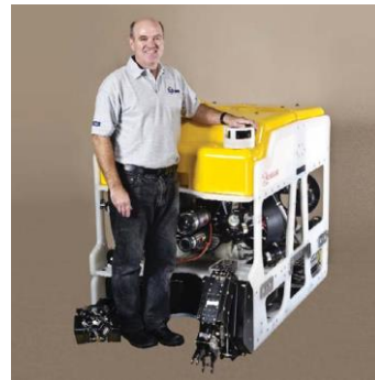
COUGER-XTi ( SKID 搭載モデル ) 3000m