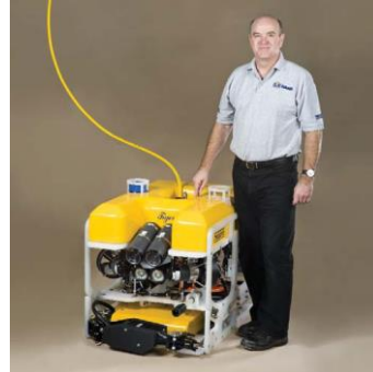
TIGER (SKID 搭載モデル) 1000m